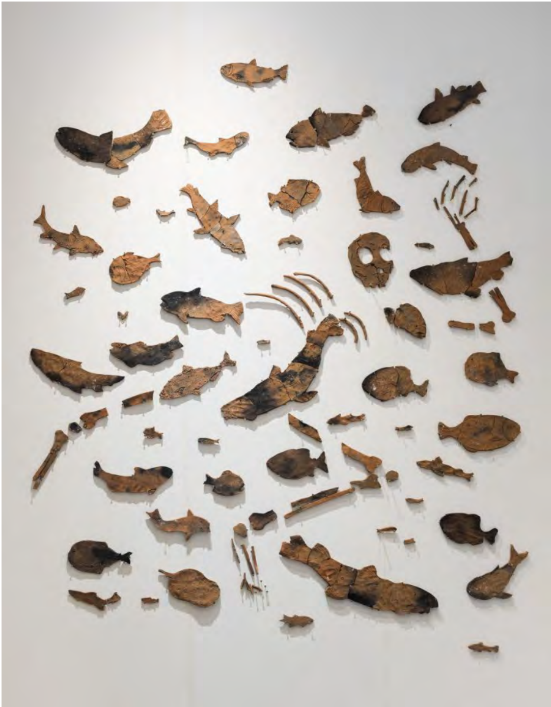
Naci2 y cria2, 2019 Barro de río cocido a fuego Paraná's river mud 200 x 300 x 5 cm Colección Oxenford