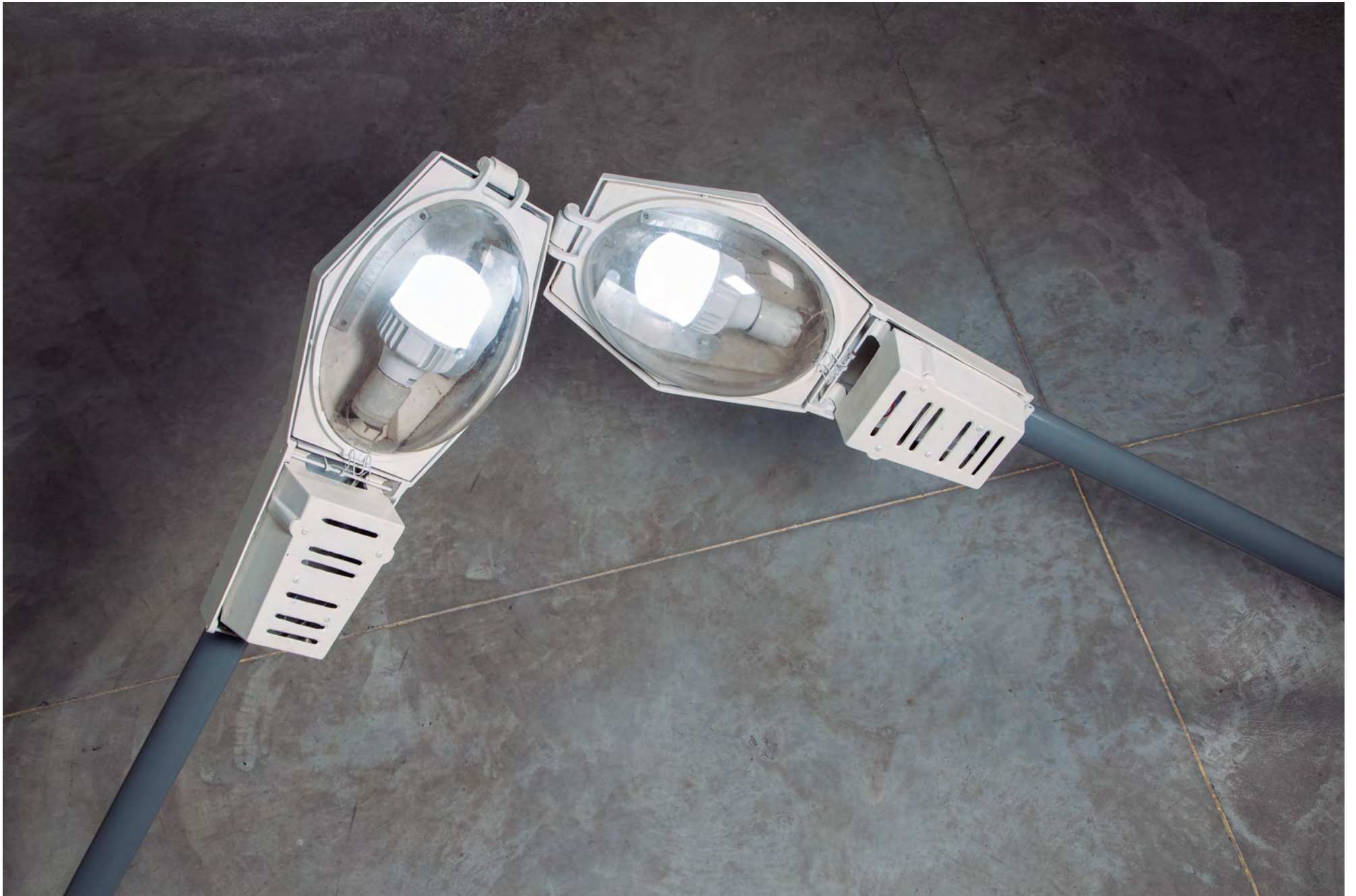
Yo adivino el parpadeo... / Detalle / Detail