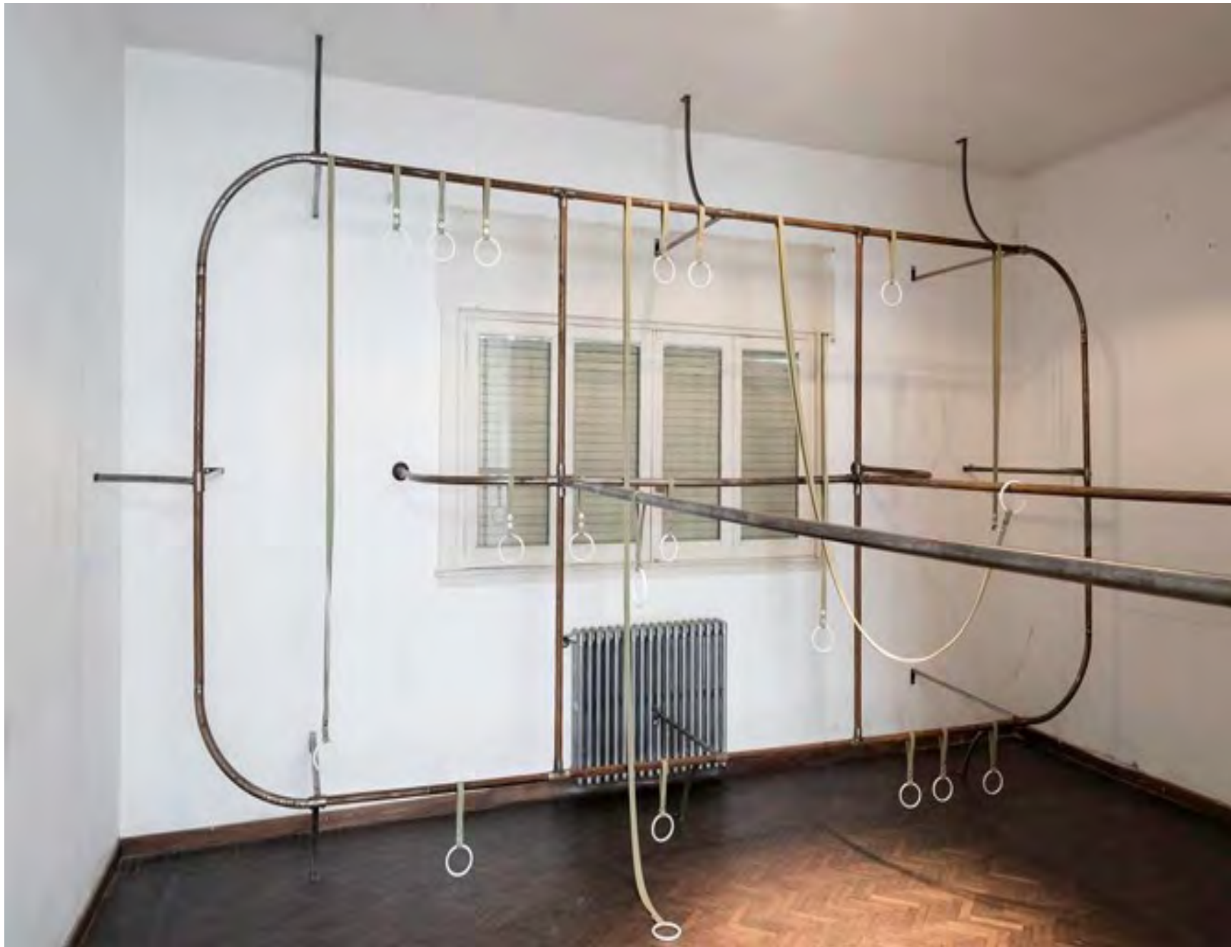
La edad madura, 2015 / Hierro, madera y soga / Iron, wood and rope / 700 x 350 x 400 cm / Colección Brun Cattaneo