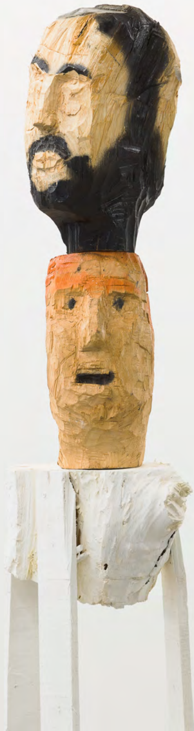
Nro 1, 2020 Talla en madera y pintura en aerosol Wood and spray painting 198 x 50 x 35 cm