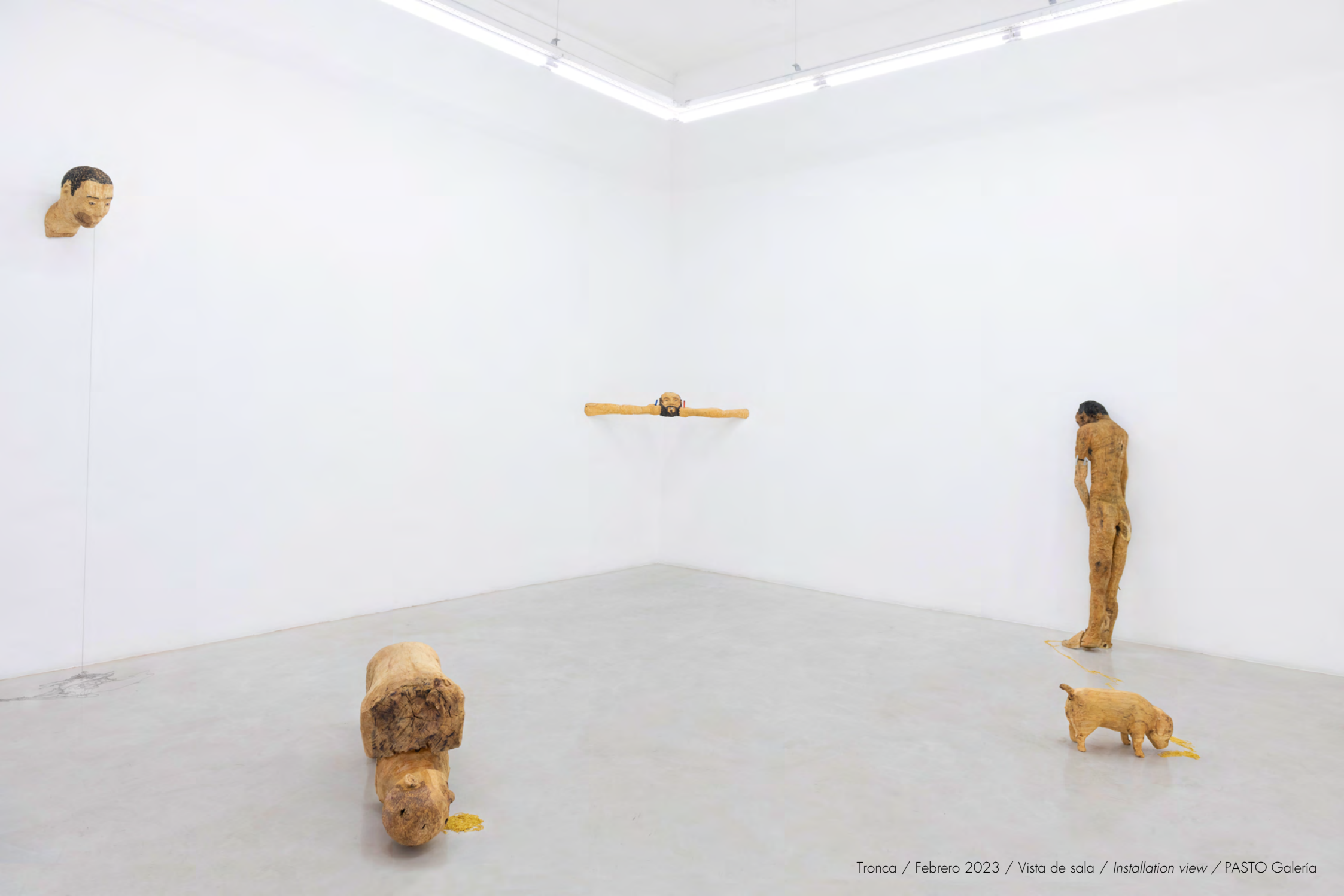
Tronca / Febrero 2023 / Vista de sala / Installation view / PASTO Galería