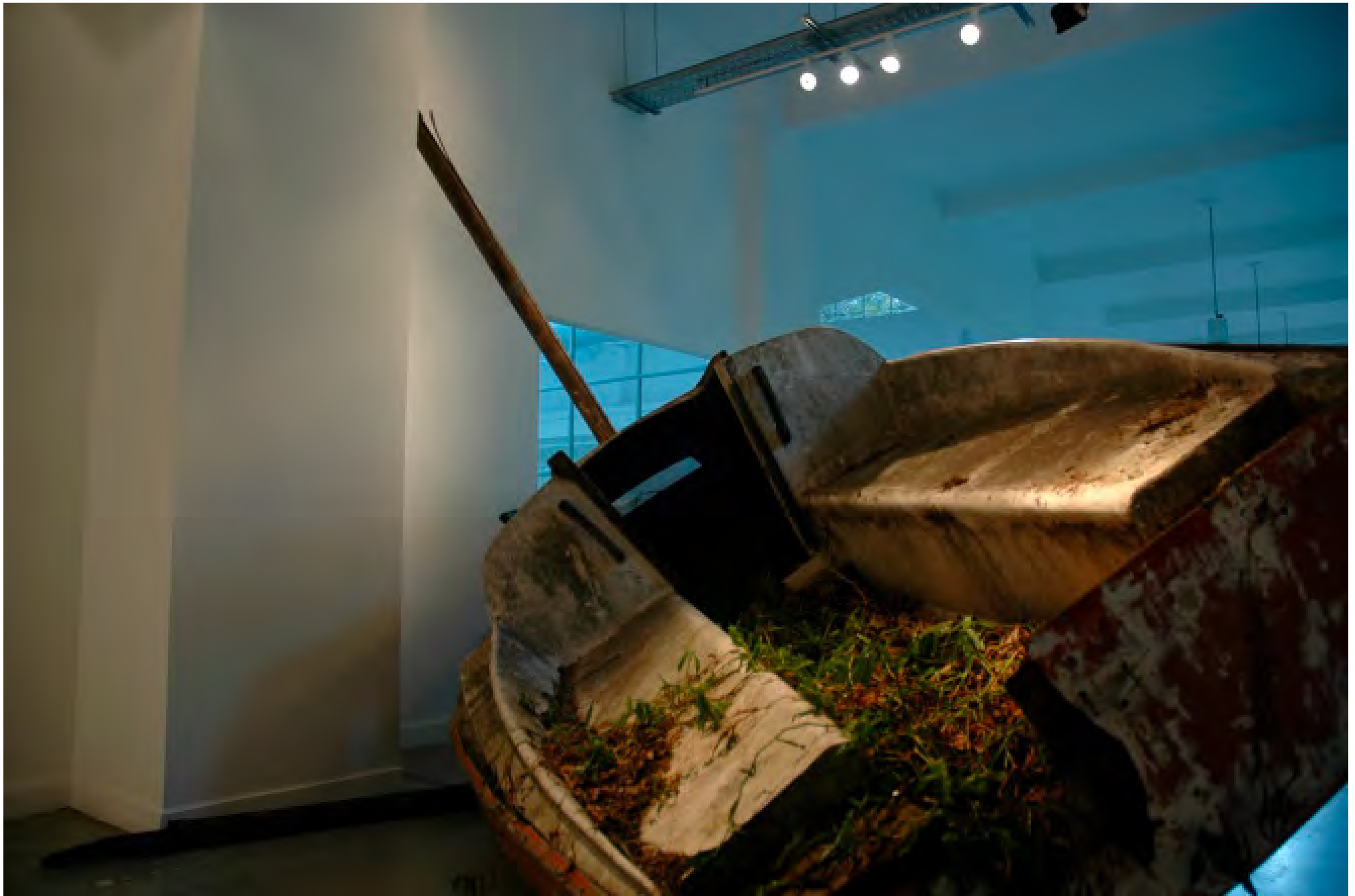
MAYDAY MAYDAY MAYDAY, 2014 / 500 x 400 x 400 cm / No disponible