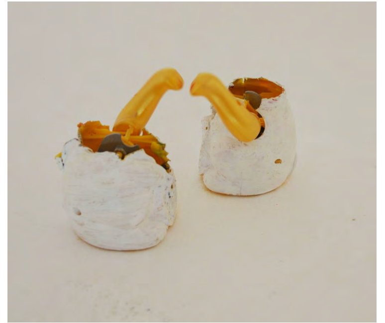
Usos y aplicaciones, 2015 / 400 x 400 x 400 cm / Colección Alejandro Iconicoff