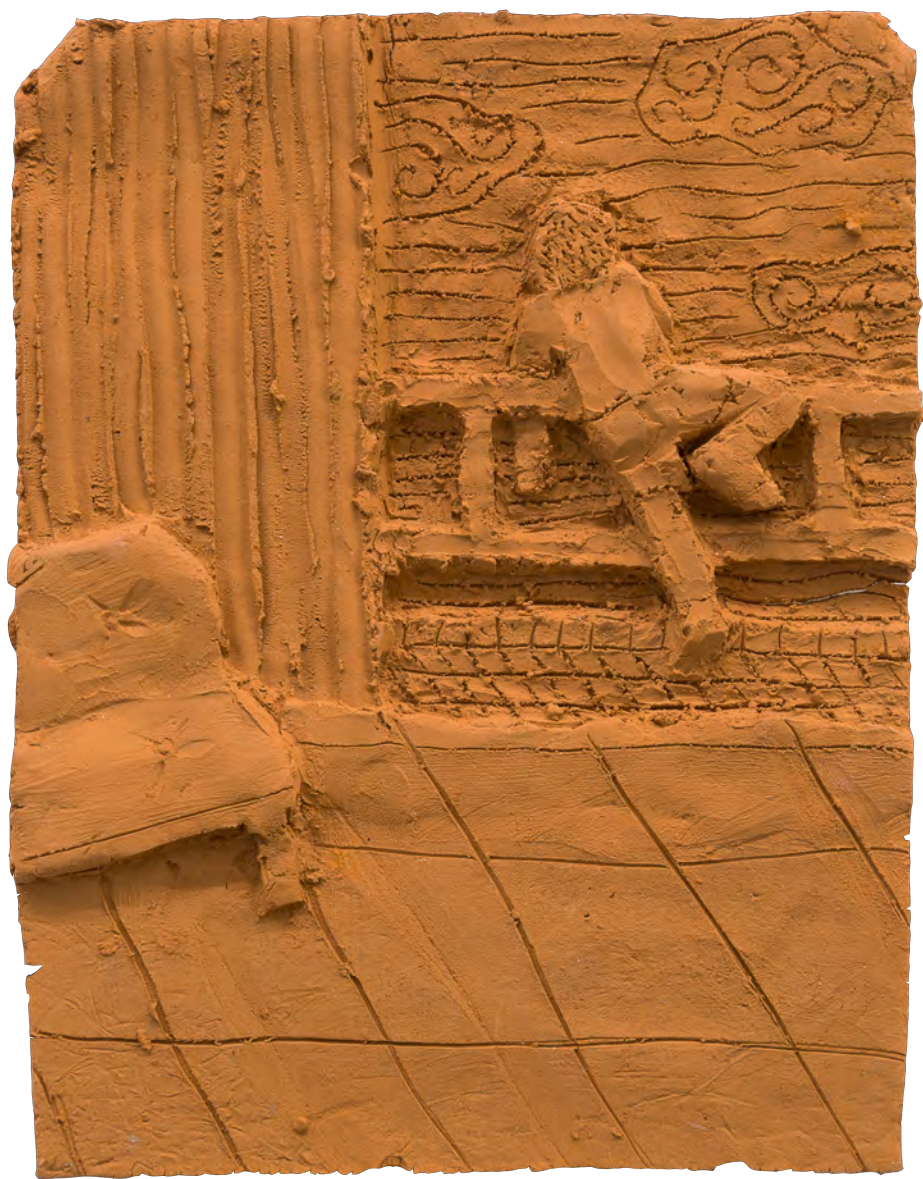
O es 3, 2020 Bajo relieve en barro del Rio Paraná cocido Low relief in Paraná's River mud 10 piezas de 25 x 18 x 2 cm Colección Fundación Andreani