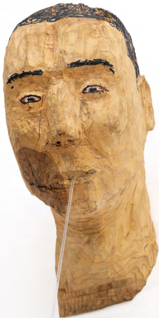
Sin título, 2022 Talla en madera (plátano), marcador y cadena Wood, ink and chain 45 x 28 x 40 cm