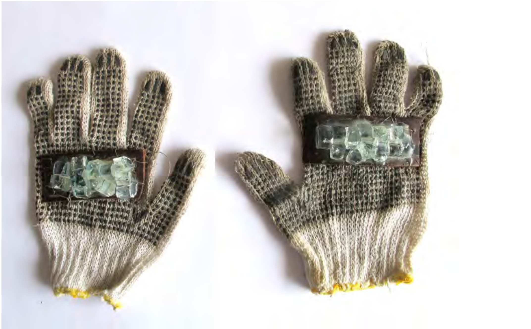
Estructura y adiestramiento, 2014 / Guantes, cuero y vidrio / Gloves, leather and glass / 30 x 50 cm / Colección Diego Benzacar