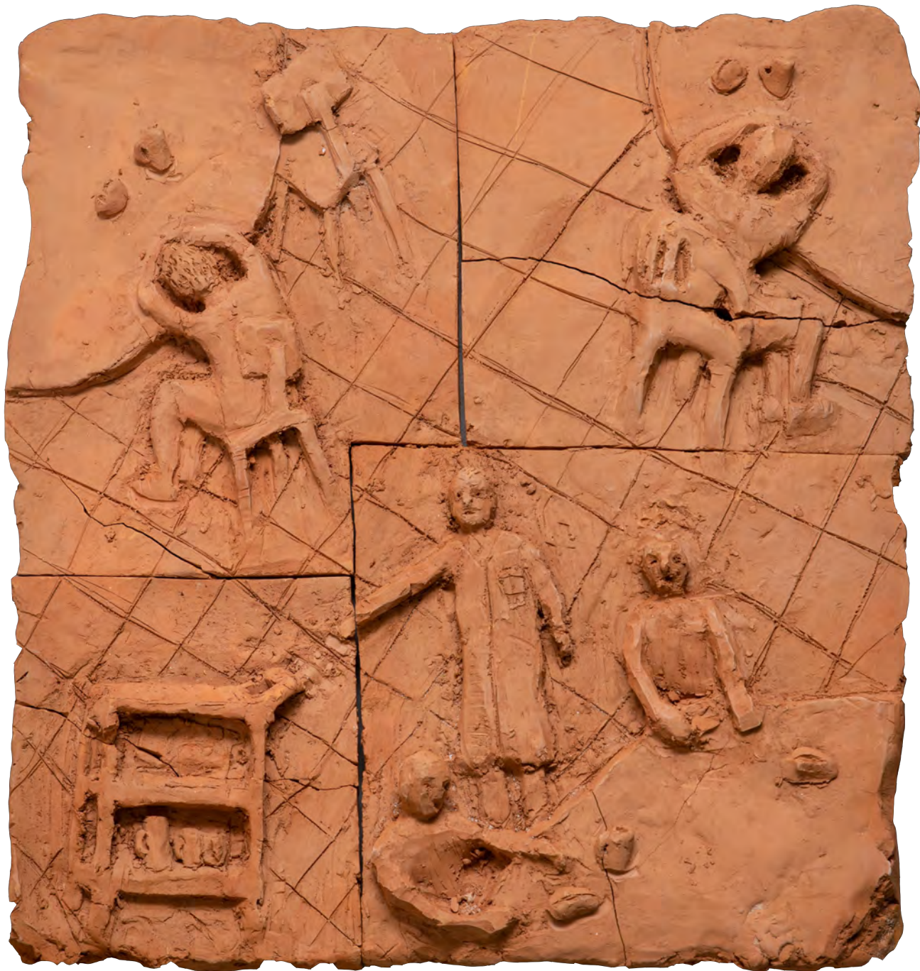
Desayuno, 2022 Bajo relieve en barro del Río Paraná cocido Low relief in Parana's River mud 50 x 55 x 7 cm