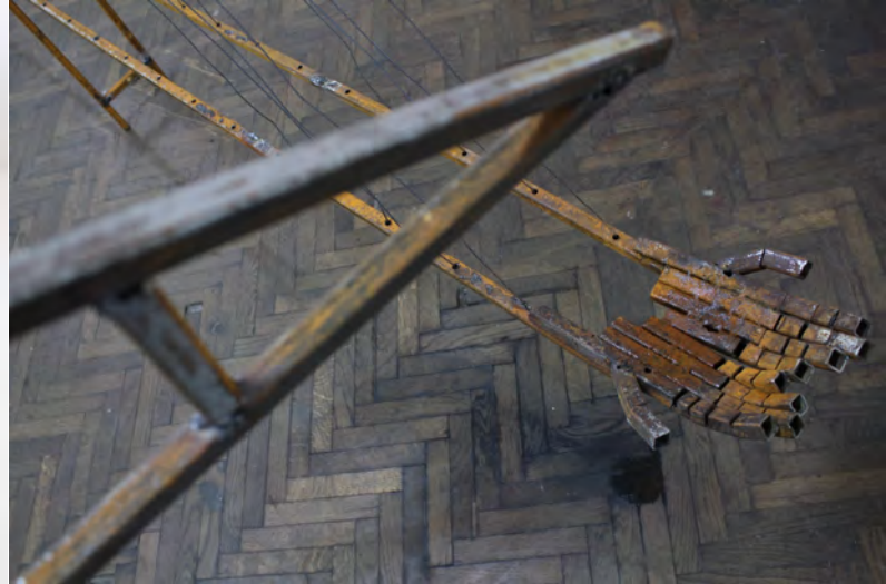
Niño jefe, 2016 Hierro Iron 700 x 350 x 400 cm Colección privada