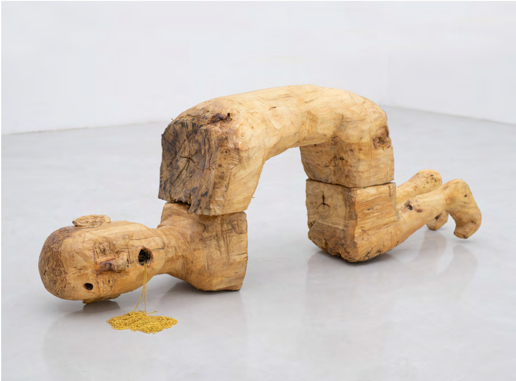
Sin título, 2023 / Talla en madera (álamo), marcador y cadena / Wood, ink and chain 55 x 140 x 35 cm