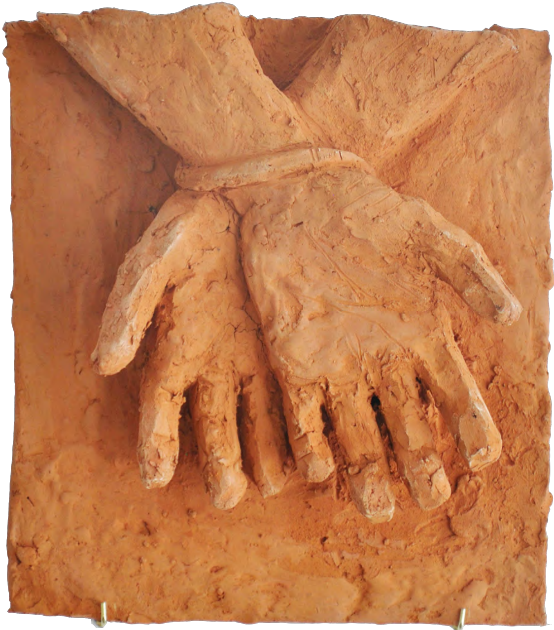
#2, 2021 Bajo relieve en barro del Río Paraná cocido Low relief in Paraná's River mud 27 x 24 x 7 cm