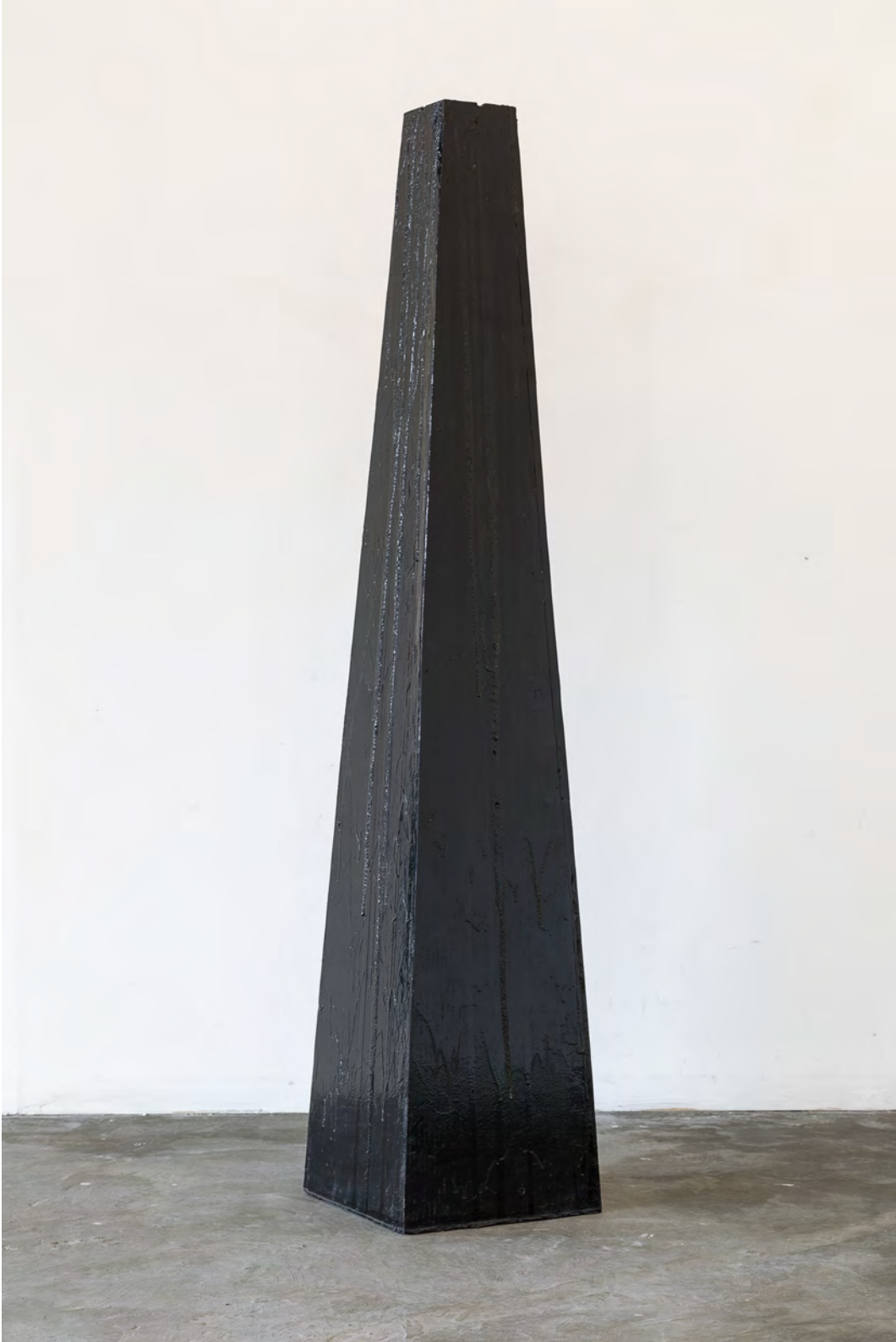
Sin título, 2017 Madera y esmalte sintético Wood and synthetic enamel 153 x 30 x 30 cm