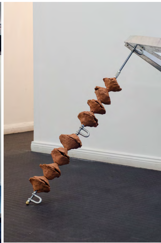
La novia desnudada por sus solteros, 2018 / Pasto Galería / Instalación / Installation / 300 x 600 x 300 cm