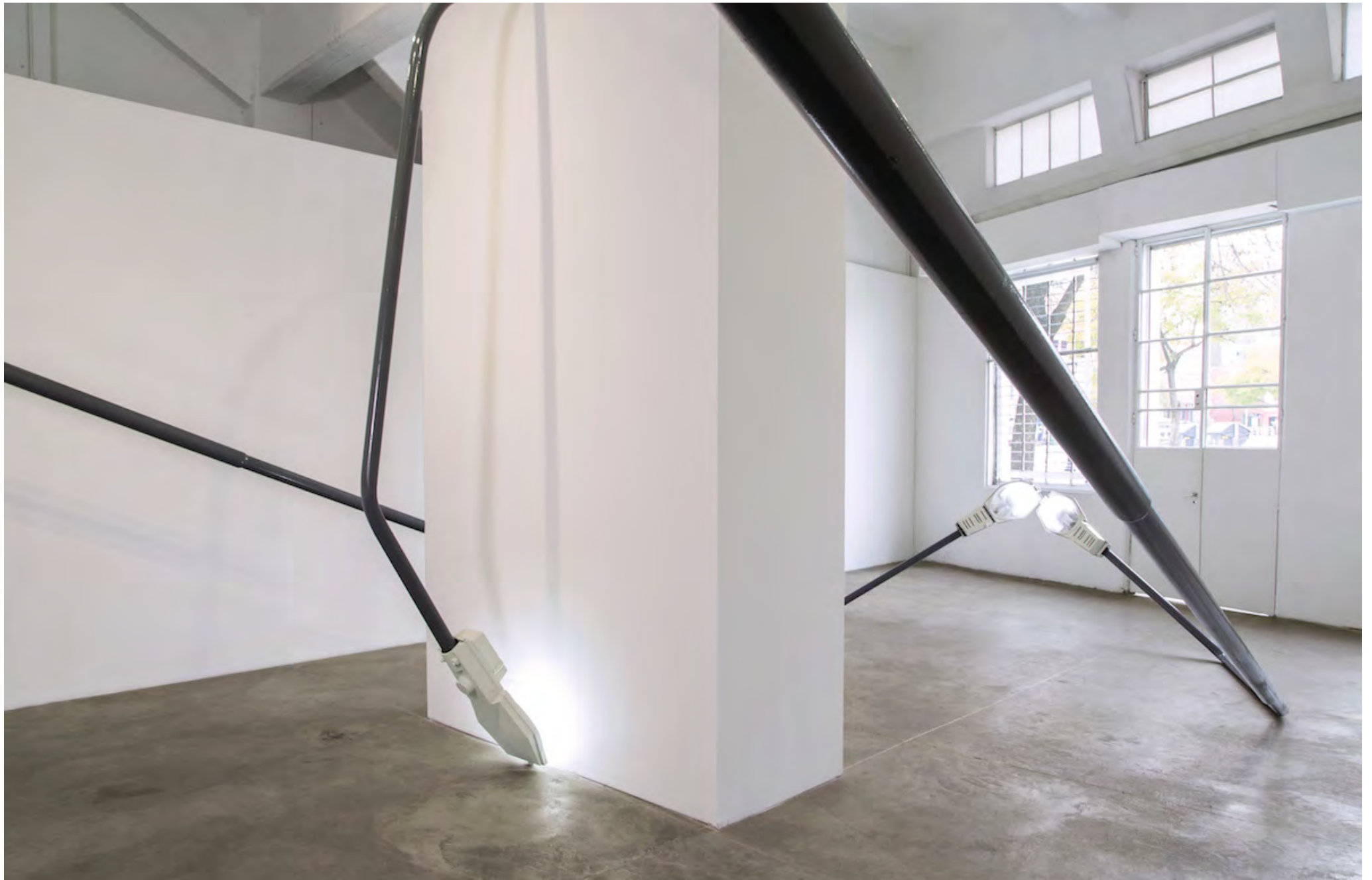
Yo adivino el parpadeo..., 2019 / Vista de sala / Installation view / Fundación Andreani