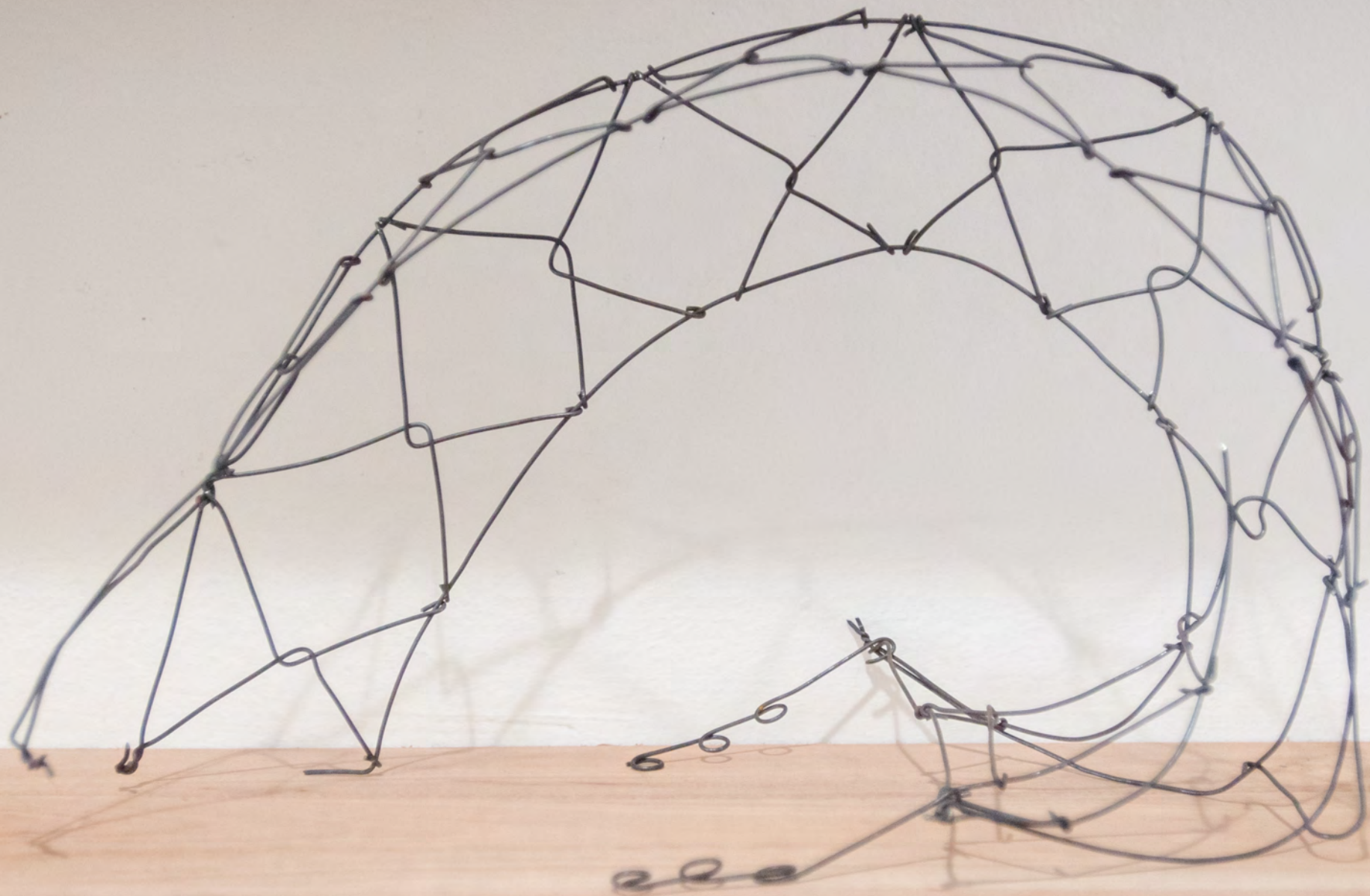
La novia desnudada por sus solteros, 2018 45 x 35 x 20 cm Colección César Abelenda