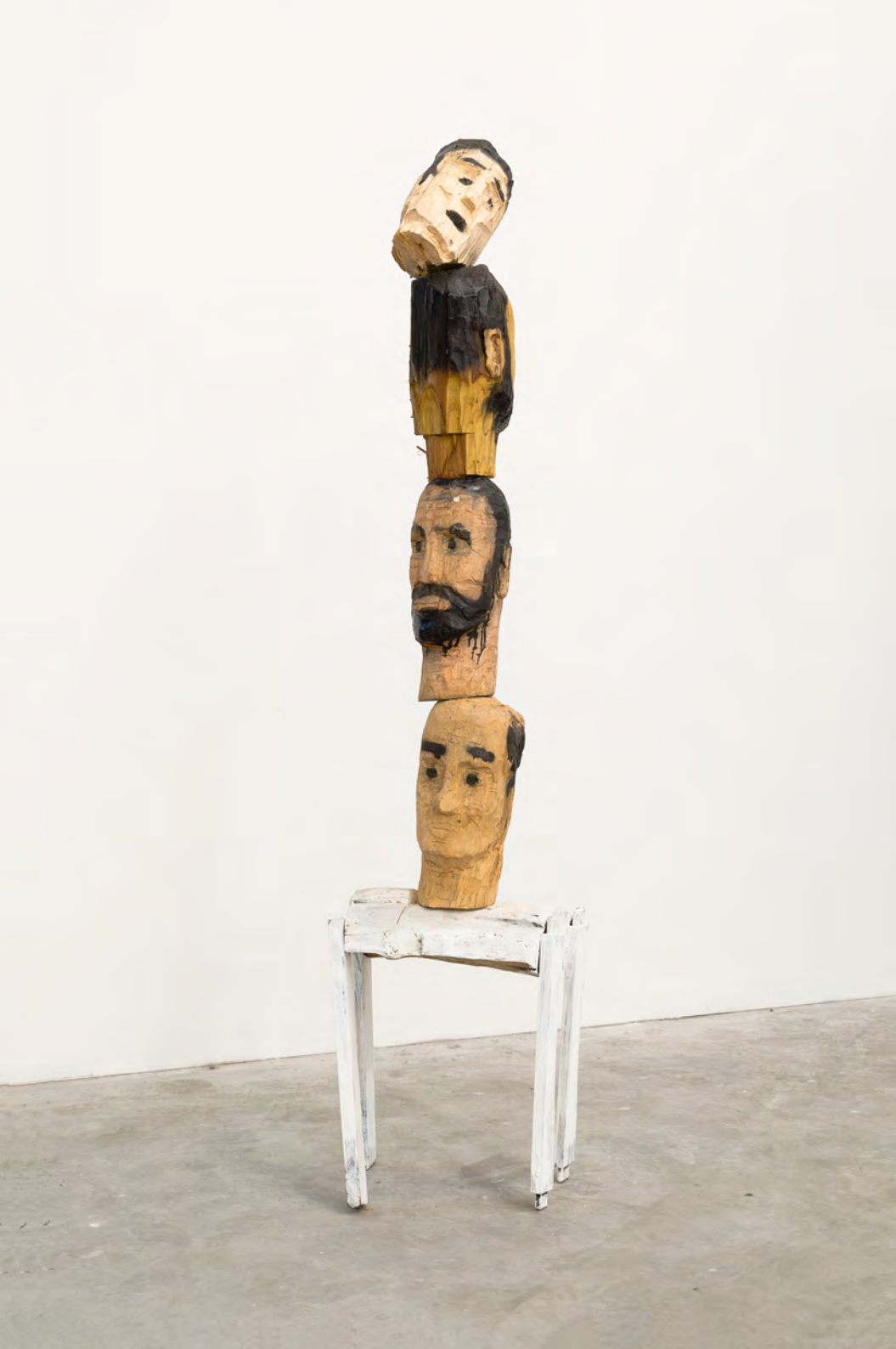
Nro 3, 2020 Talla en madera y pintura en aerosol Wood and spray painting 157 x 30 x 25 cm