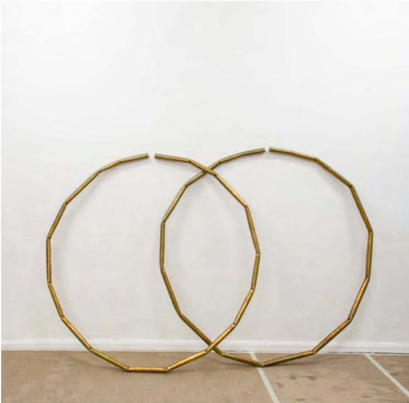
Argolla, 2017 Bronze Bronze 175 x 175 x 7 cm Colección Brun Cattaneo