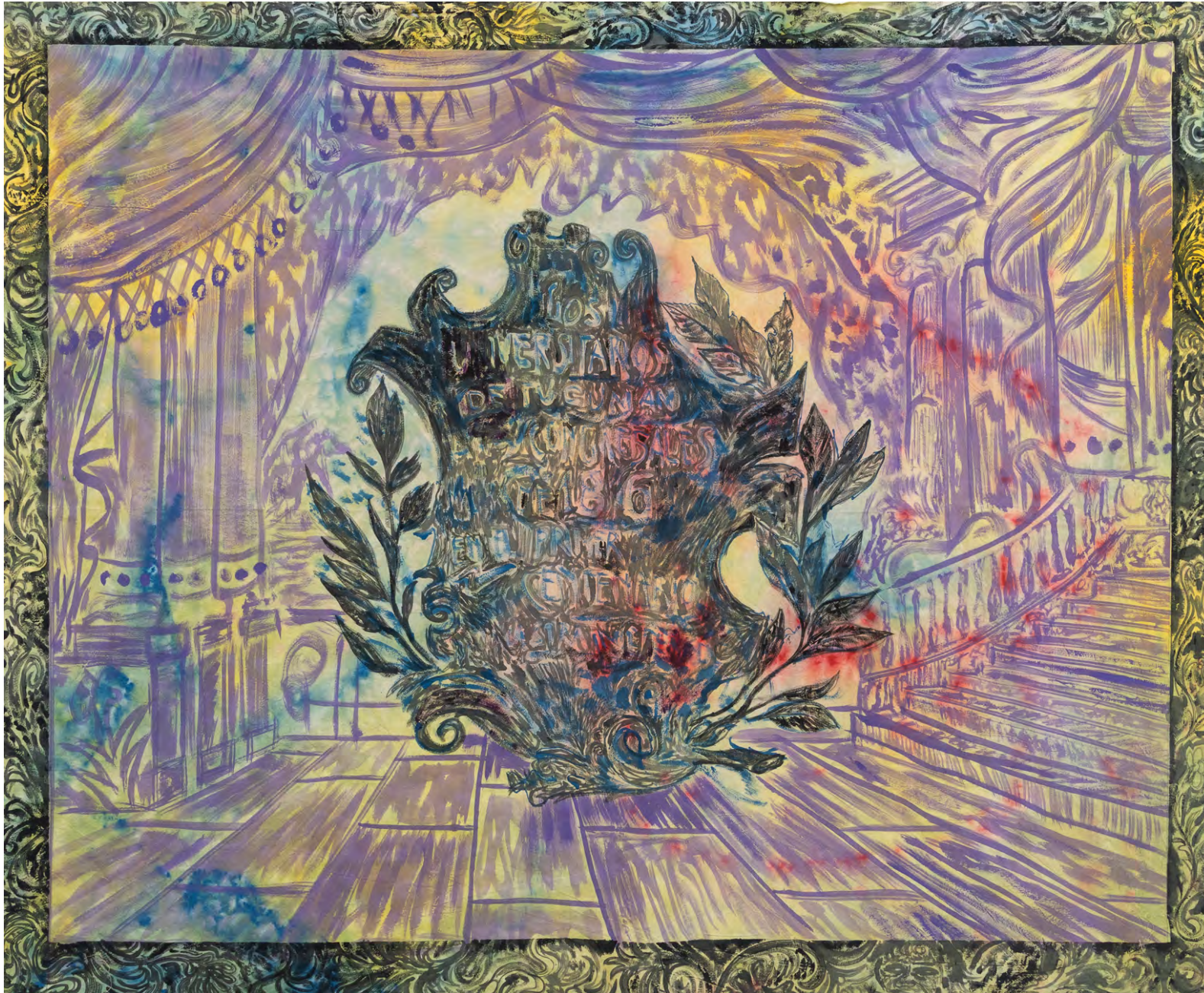
Placa 2022 Acrílico y latex sobre lienzo sin imprimir Acrylic and latex on unprimed canvas 170 x 205 cm Premio Especial Concurso Artes Visuales FNA, 2022