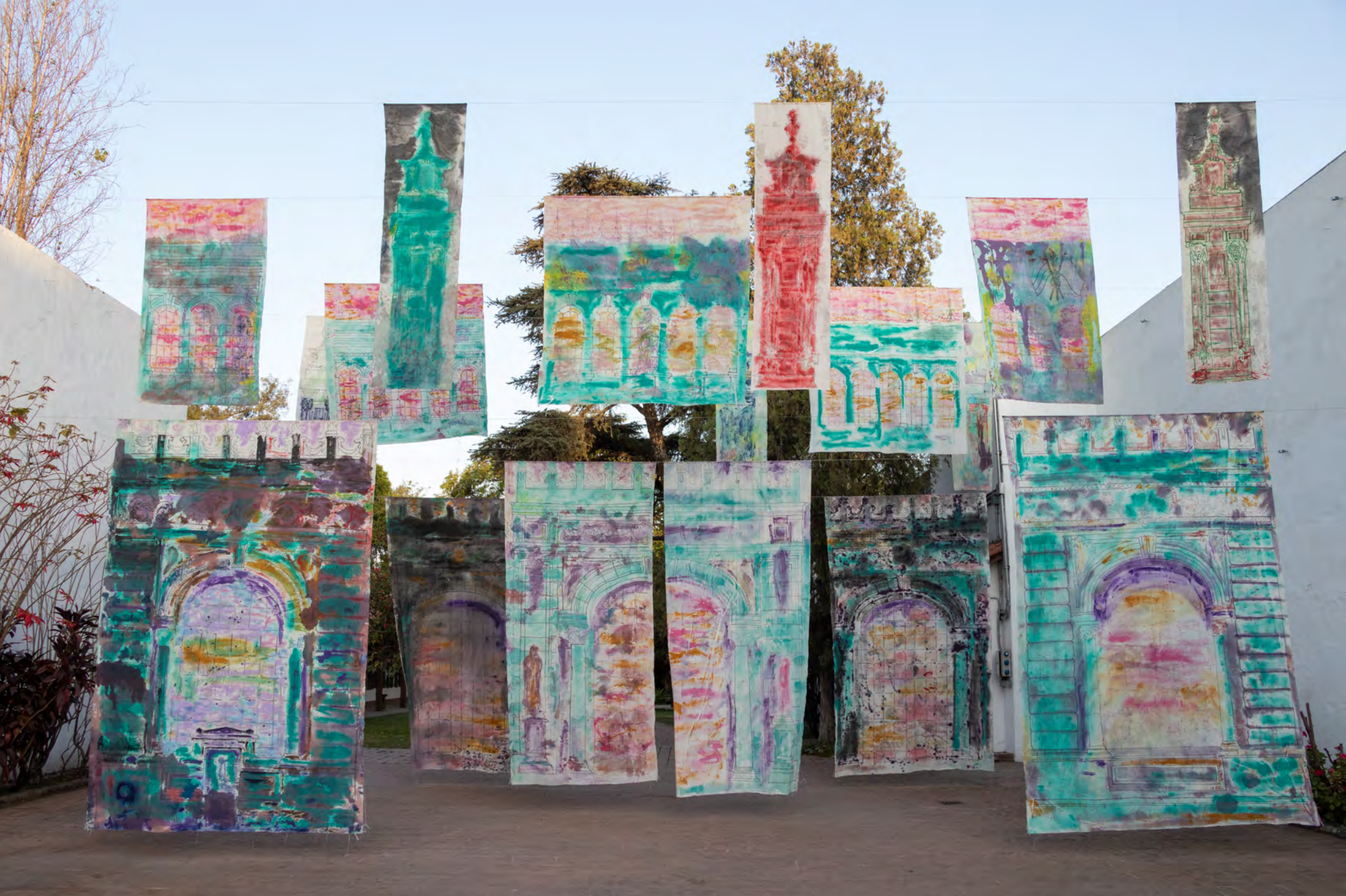
Estudio para la reconstrucción histórica de templo / Casa Histórica de Tucumán / Octubre 2023