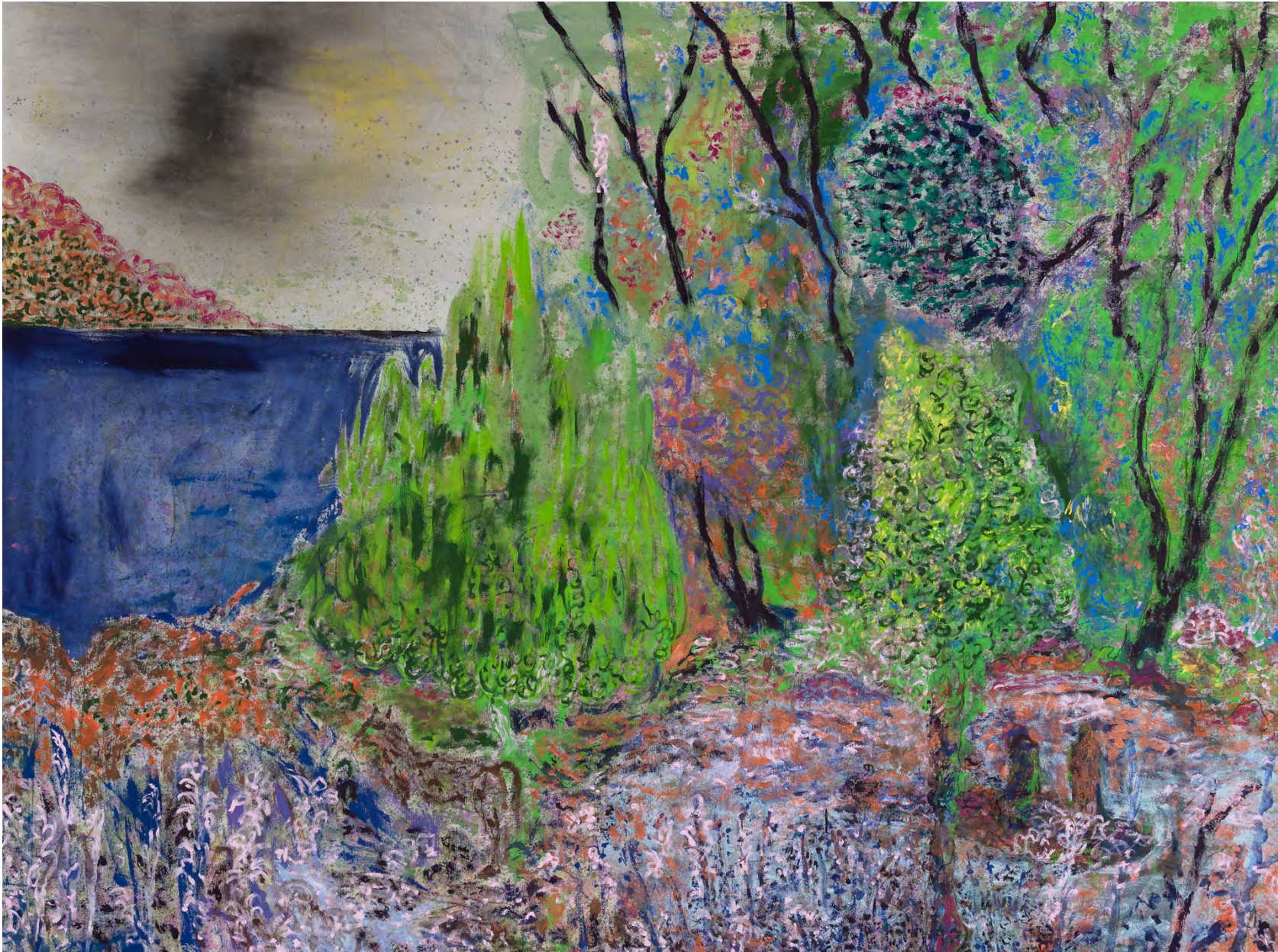
Dique, 2023 Acrílico y latex sobre tussor Acrylic and latex on tussor 150 x 200 cm