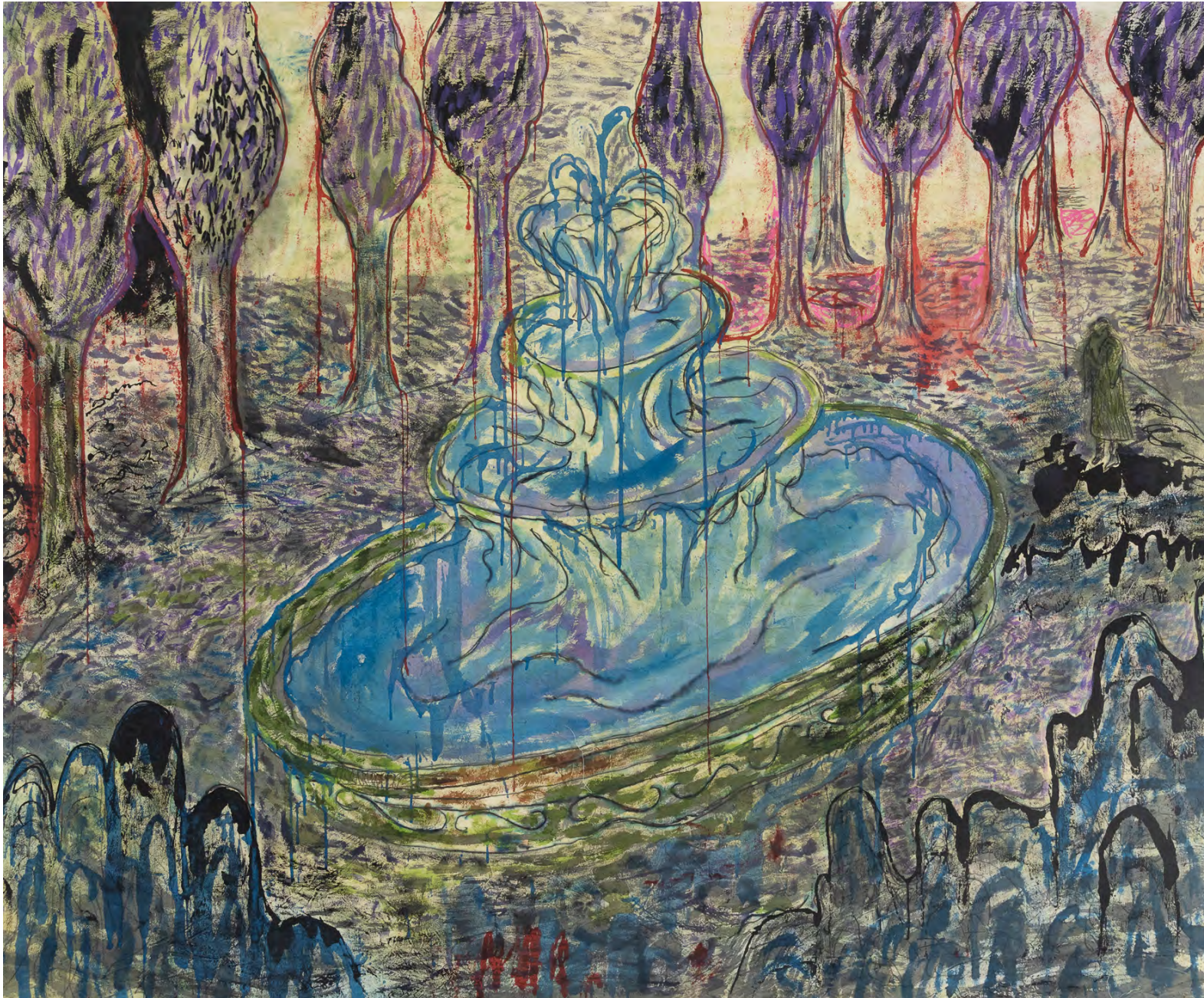
Fuente 2022 Acrílico y latex sobre lienzo sin imprimir Acrylic and latex on unprimed canvas 170 x 205 cm