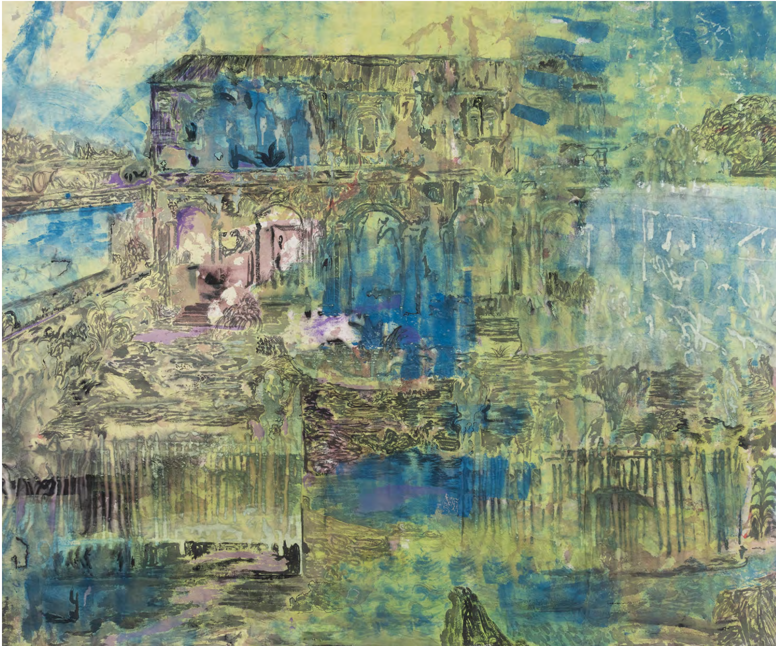
Templete, 2022 Acrílico y latex sobre lienzo sin imprimir 170 x 205 cm 3er Premio Adquisición 110 Salón Nacional de Artes Visuales 2022. Palais de Glace, Argentina