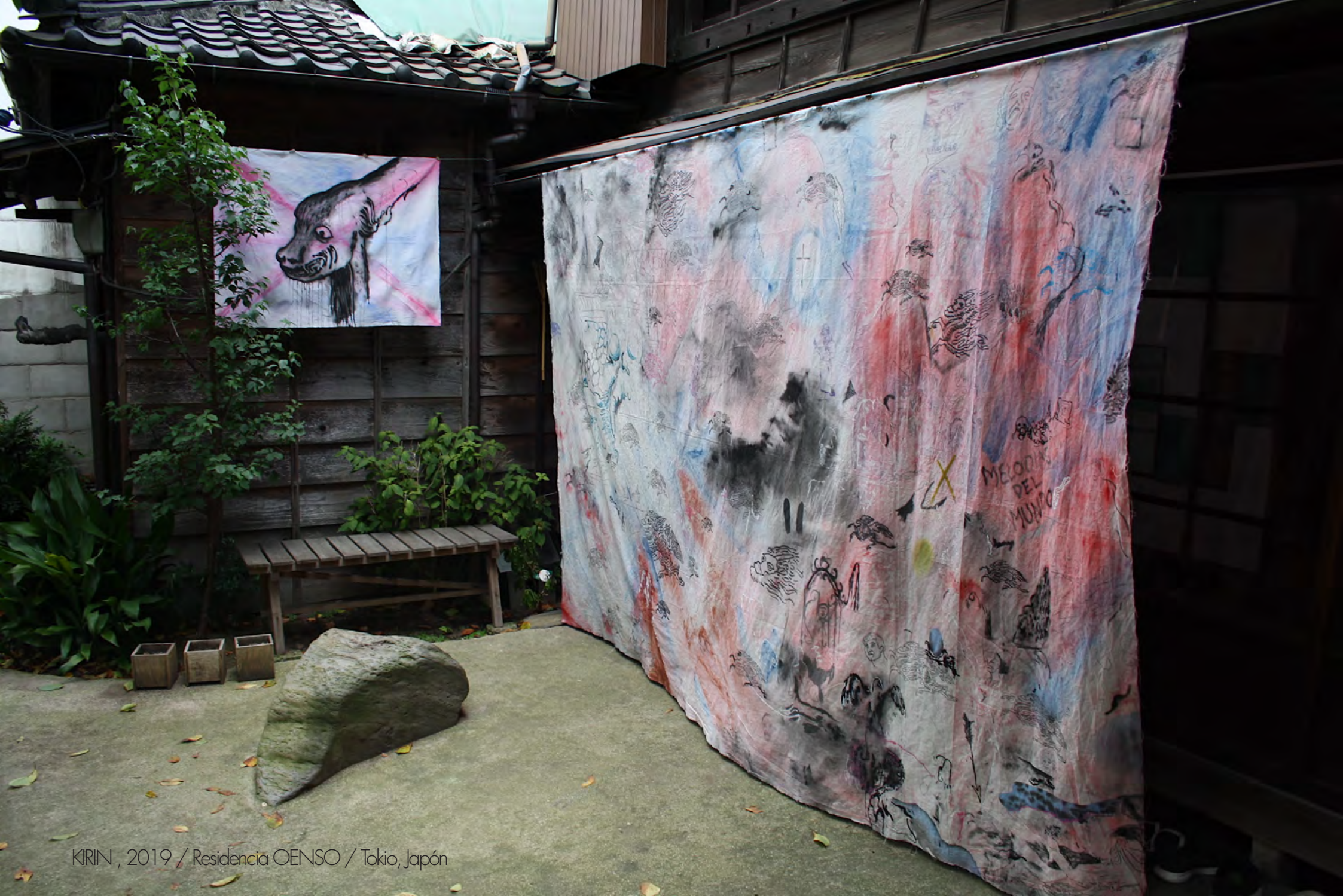
KIRIN, 2019 / Residencia OENSO / Tokio, Japón