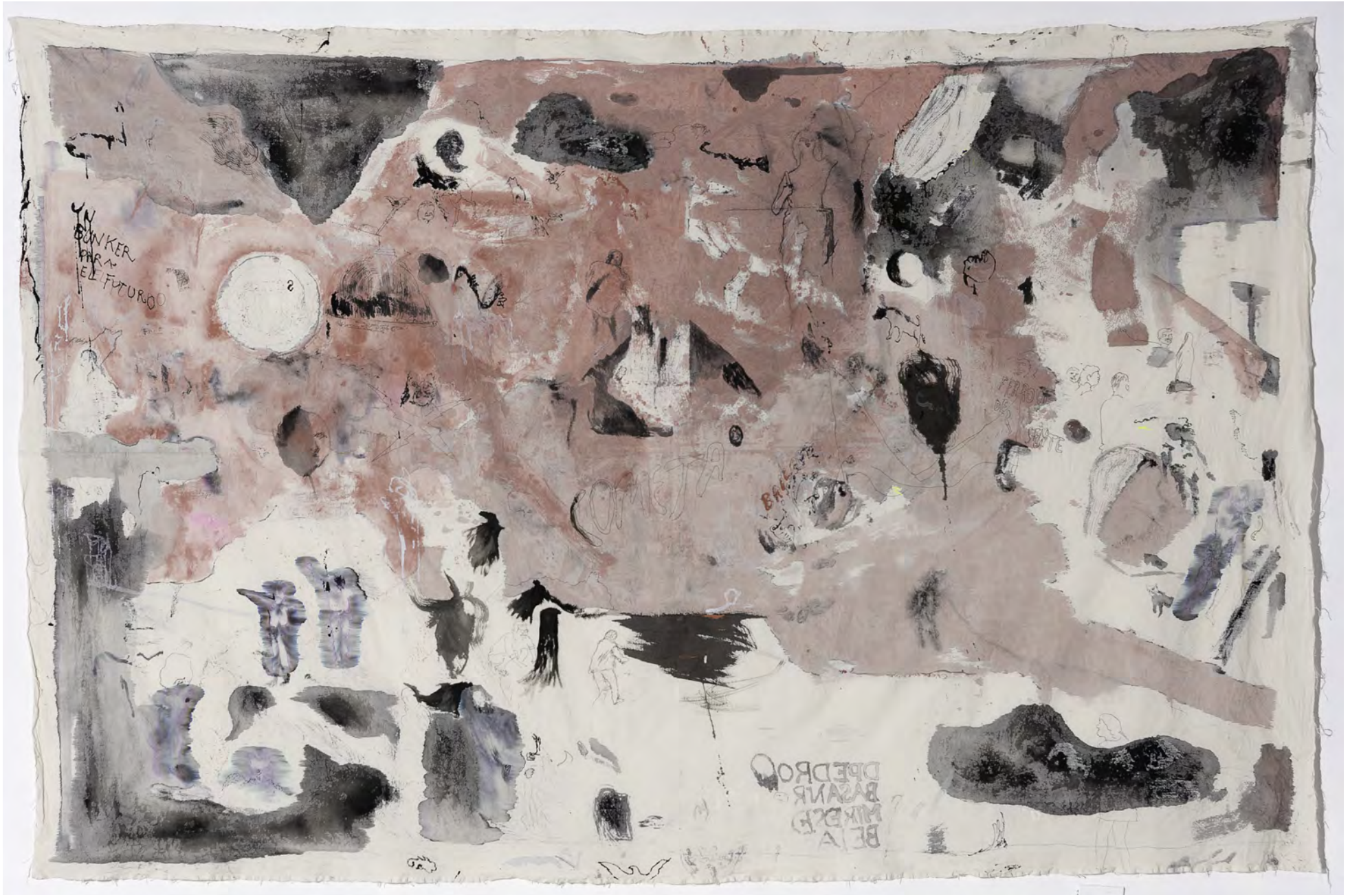
Pretérito perfecto, 2015 / Acrílico, tinta, marcadores y lapicera sobre tela / 300 x 250 cms