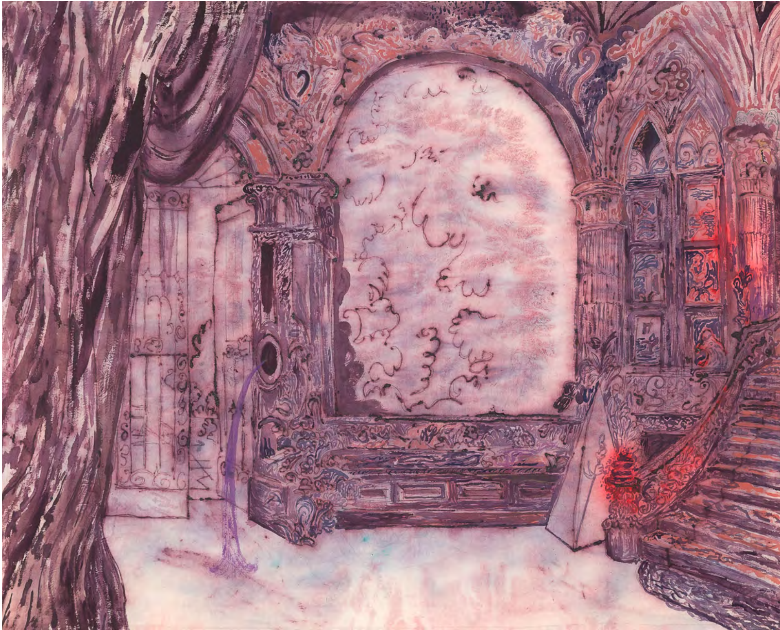
Salón con escalera, 2021 Acrílico, latex y barniz sobre lienzo 120 x 150 cm 1er Premio Adquisición Banco Central 2022