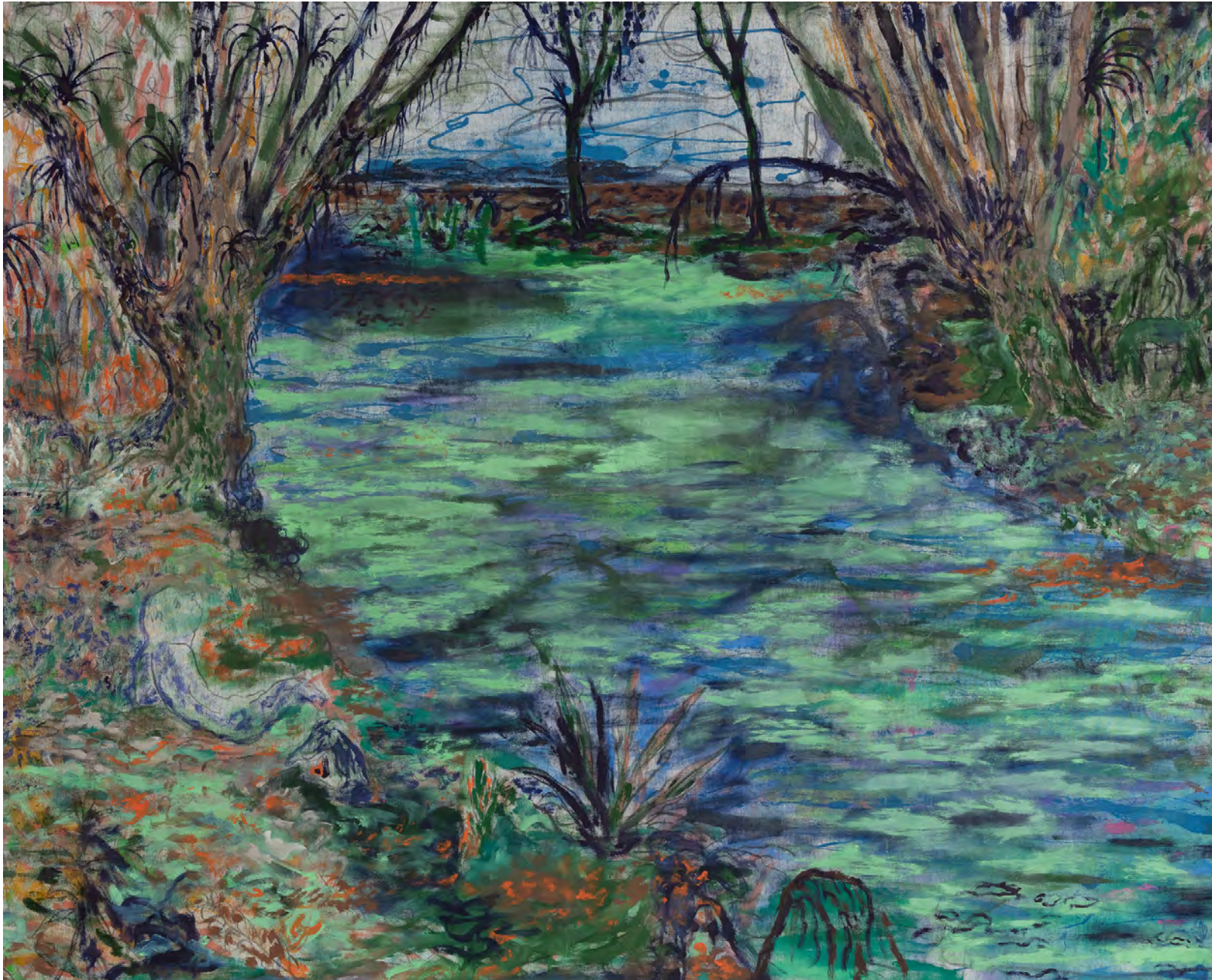
Orilla, 2023 Acrílico, grafito, latex y barniz sobre lienzo Acrylic and latex on canvas 120 x 150 cm