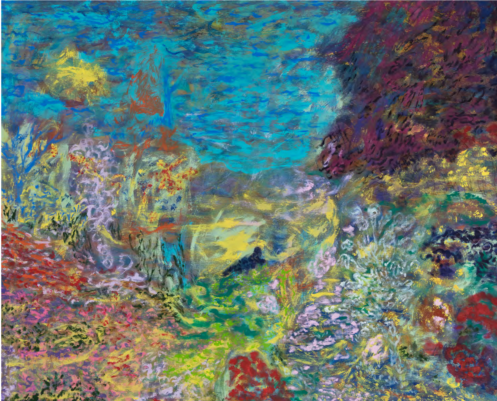
Cerca de la orilla, 2023 Acrílico y latex sobre gabardina Acrylic and latex on gabardine 120 x 150 cm