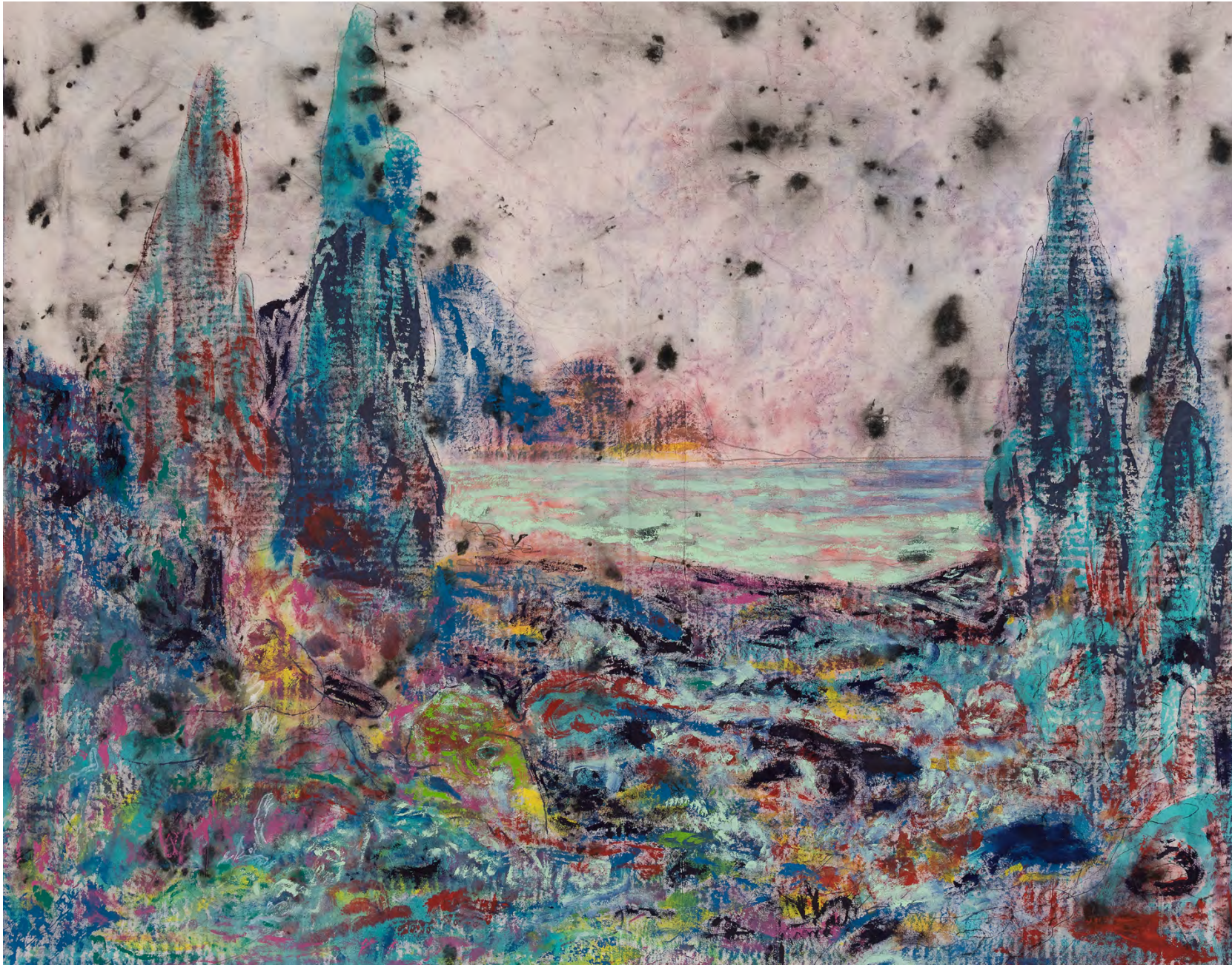
Aguas del dique, 2023 Acrílico, latex y grafito sobre lienzo sin imprimir Acrylic and latex on unprimed canvas 150 x 200 cm