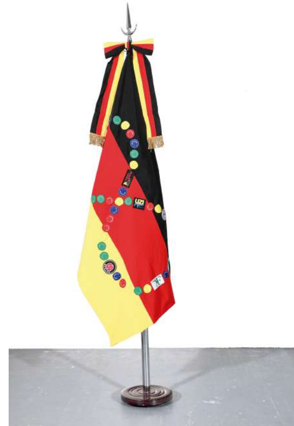
Alemania, 2018 Bandera oficial de ceremonia intervenida con parches Official ceremony flag intervened with handmade patches 140 x 90 cm