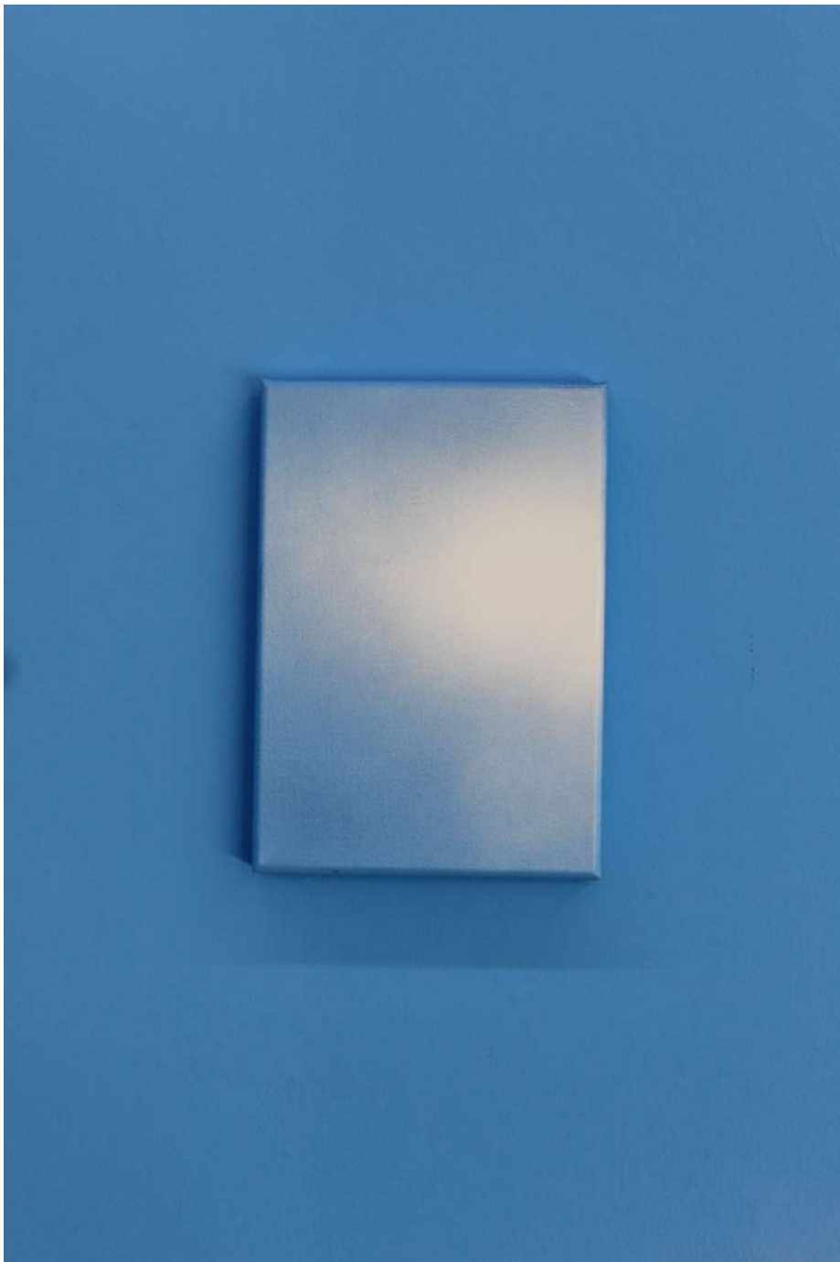
Cielo 10, 2021 Acrílico y esmalte sintético sobre tela Acrylic and synthetic enamel on canvas 35 x 25 cm