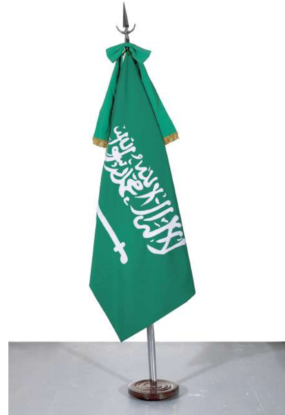
Arabia Saudita, 2018 Bandera oficial de ceremonia intervenida con parches Official ceremony flag intervened with handmade patches 140 x 90 cm