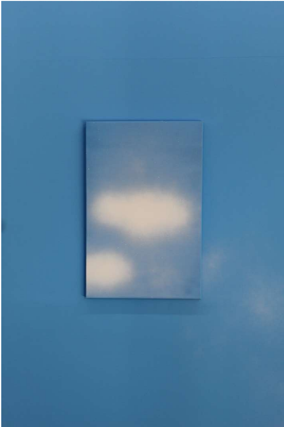
Cielo 6, 2021 Acrílico y esmalte sintético sobre tela Acrylic and synthetic enamel on canvas 60 x 40 cm