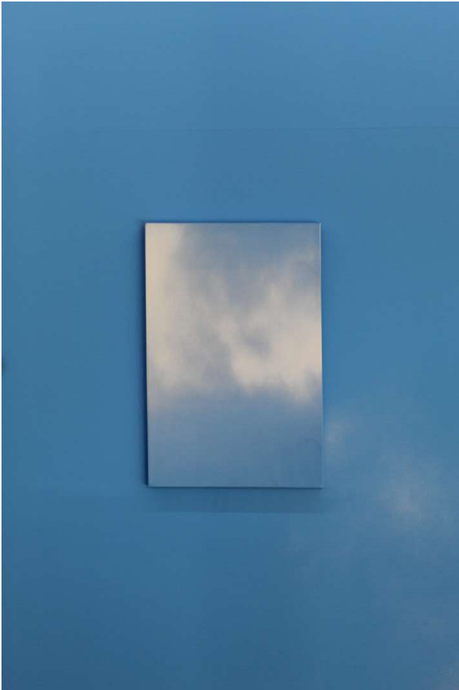
Cielo 5, 2021 Acrílico y esmalte sintético sobre tela Acrylic and synthetic enamel on canvas 70 x 50 cm