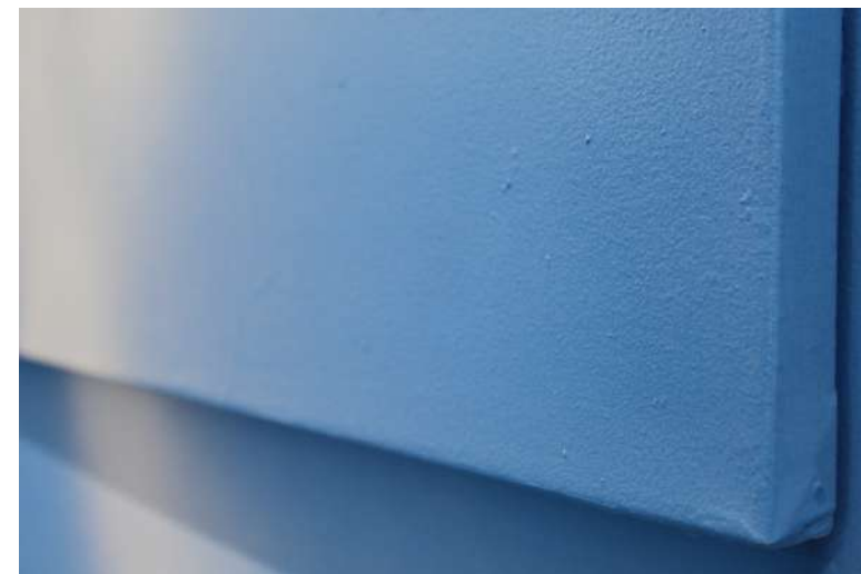
Cielo 2, 2021 Acrílico y esmalte sintético sobre tela Acrylic and synthetic enamel on canvas 120 x 75 cm