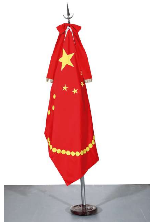
China, 2018 Bandera oficial de ceremonia intervenida con parches Official ceremony flag intervened with handmade patches 140 x 90 cm