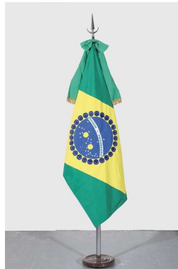
Brasil, 2018 Bandera oficial de ceremonia intervenida con parches Official ceremony flag intervened with handmade patches 140 x 90 cm