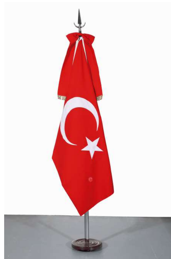
Turquía, 2018 Bandera oficial de ceremonia intervenida con parches Official ceremony flag intervened with handmade patches 140 x 90 cm