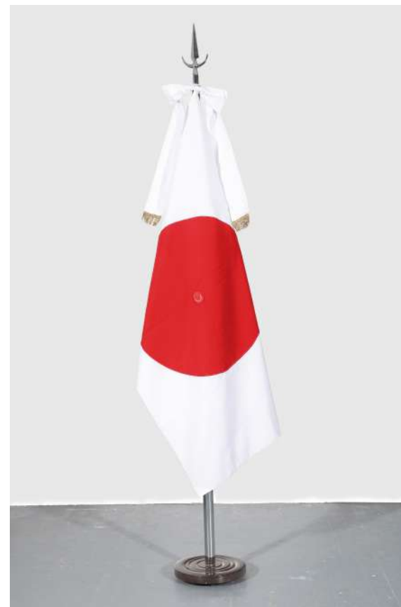
Japón, 2018 Bandera oficial de ceremonia intervenida con parches Official ceremony flag intervened with handmade patches 140 x 90 cm