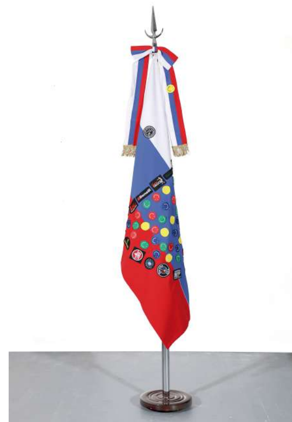
Rusia, 2018 Bandera oficial de ceremonia intervenida con parches Official ceremony flag intervened with handmade patches 140 x 90 cm