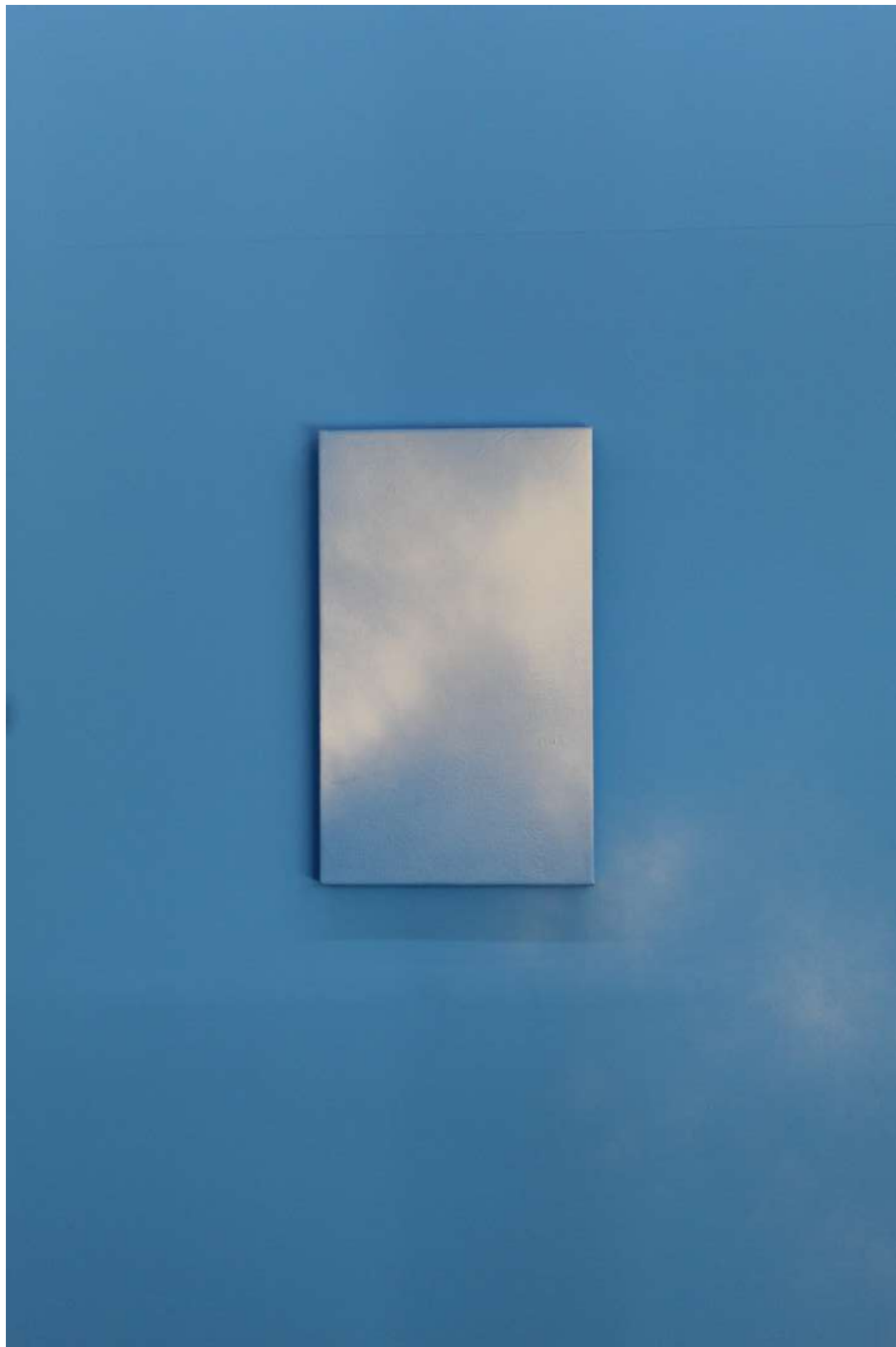
Cielo 8, 2021 Acrílico y esmalte sintético sobre tela Acrylic and synthetic enamel on canvas 50 x 30 cm