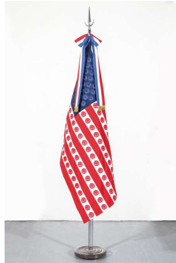
Estados Unidos, 2018 Bandera oficial de ceremonia intervenida con parches Official ceremony flag intervened with handmade patches 140 x 90 cm