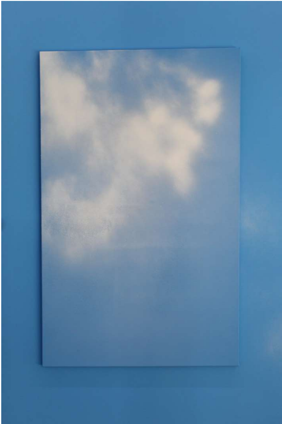
Cielo 4, 2021 Acrílico y esmalte sintético sobre tela Acrylic and synthetic enamel on canvas 120 x 75 cm