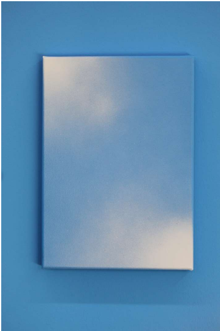
Cielo 1, 2021 Acrílico y esmalte sintético sobre tela Acrylic and synthetic enamel on canvas 120 x 75 cm