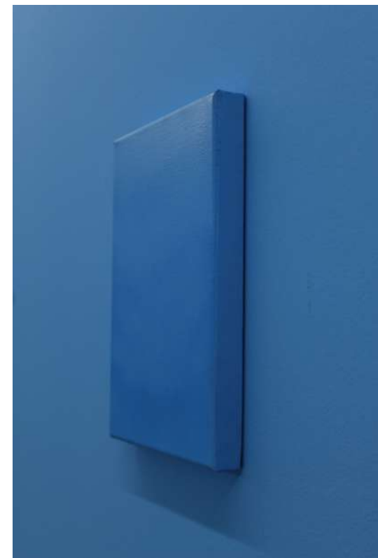
Cielo 11, 2021 Acrílico sobre tela Acrylic on canvas 25 x 17.5 cm